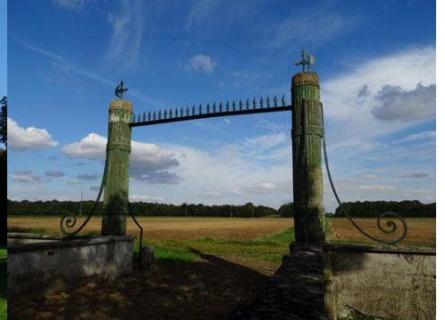
La portail à faisceaux et francisques

Pour la zone en rose foncé dans le périmètre de 500m