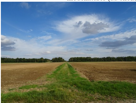
La perspective est, avec champs et bois

Les avis seront cohérents avec ceux émis ces dernières années, à savoir : pas de maisons à volume compliqué (type V, W, Y, ou Z), Rez-de-chaussée + Combles, pentes à 45° pour les volumes principaux, ardoise ou tuile plate de teinte brun vieilli, à 20u/m², avec un débord de toiture de 20cm, enduit de teinte beige clair avec modénatures (au choix : chaînages, encadrement de fenêtres, soubassement, colombage...). *Voir autres fiches.