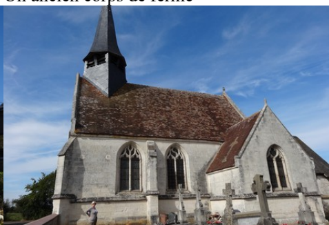
L'église de Barquet