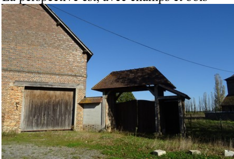
L'entrée d'une ferme