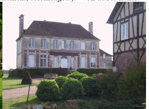
Une grande demeure rurale