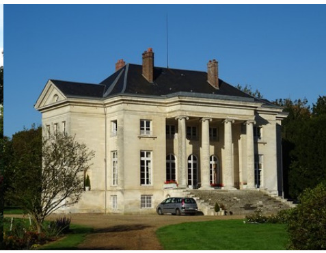
La façade est (vue rapprochée)