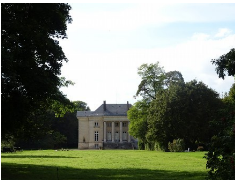
La façade est du château