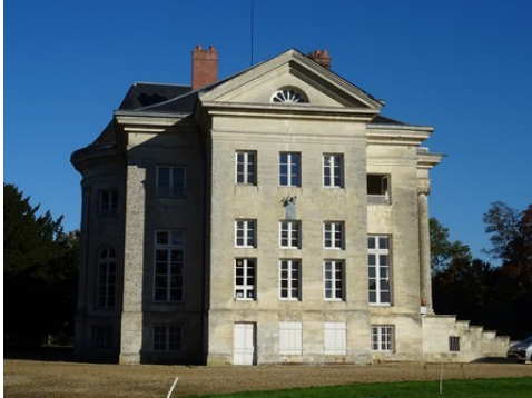
La façade sud