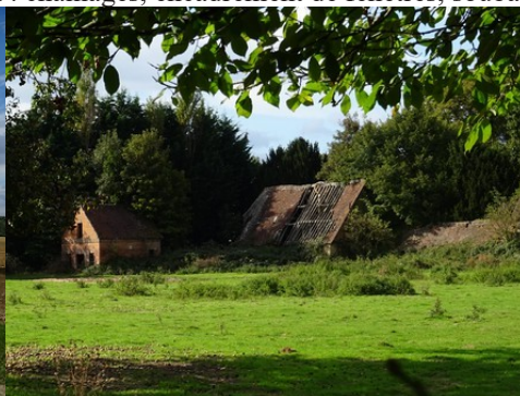
Un ancien corps de ferme