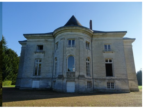
La façade ouest du château